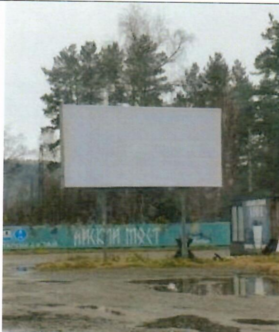
Фото рекламной конструкции

«15» ноября 2024 года отделом архитектуры и градостроительства Администрации муниципального образования «Майминский район» выявлена рекламная конструкция, установленная и (или) эксплуатируемая без разрешения, срок действия которого не истек, установленного по адресу (в случае отсутствия технической возможности определить точное местоположение, указывается ориентировочное расположение): 454км.+960м. трассы М-52 «Чуйский тракт» (справа) в границах земельного участка с кадастровым номером 04:01:011501:179.